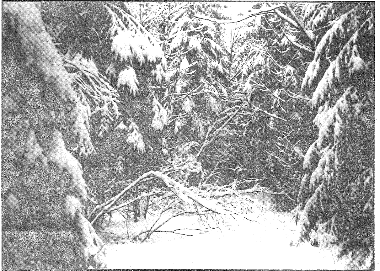
◆ Kluss un noslepumains ziemas miega snauž mežs...

A.Žugris, leitnants, Preiļu bataljona informācijas nodaļas priekšnieks