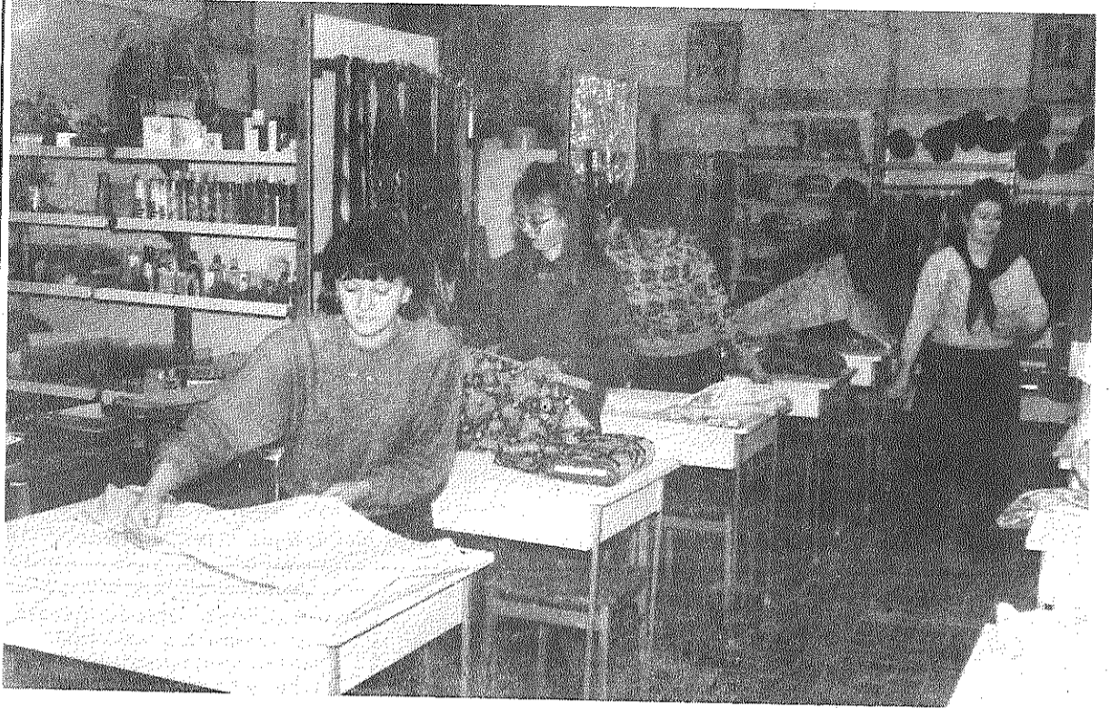
T-5 grupas audzēkņi skolas mācību veikalā.

Skola dibināta 1974. gadā sākumā kā Latvijas Patērētāju biedrību savienības Preiļu mācību punkts — kadru kvalifikācijas paaugstināšanai. Ar 1976. gadu mācību punkts pārtop par profesionāli tehnisko skolu, kura gatavo pārdevējus un maizes cepējus patērētāju kooperācijas sistēmai.