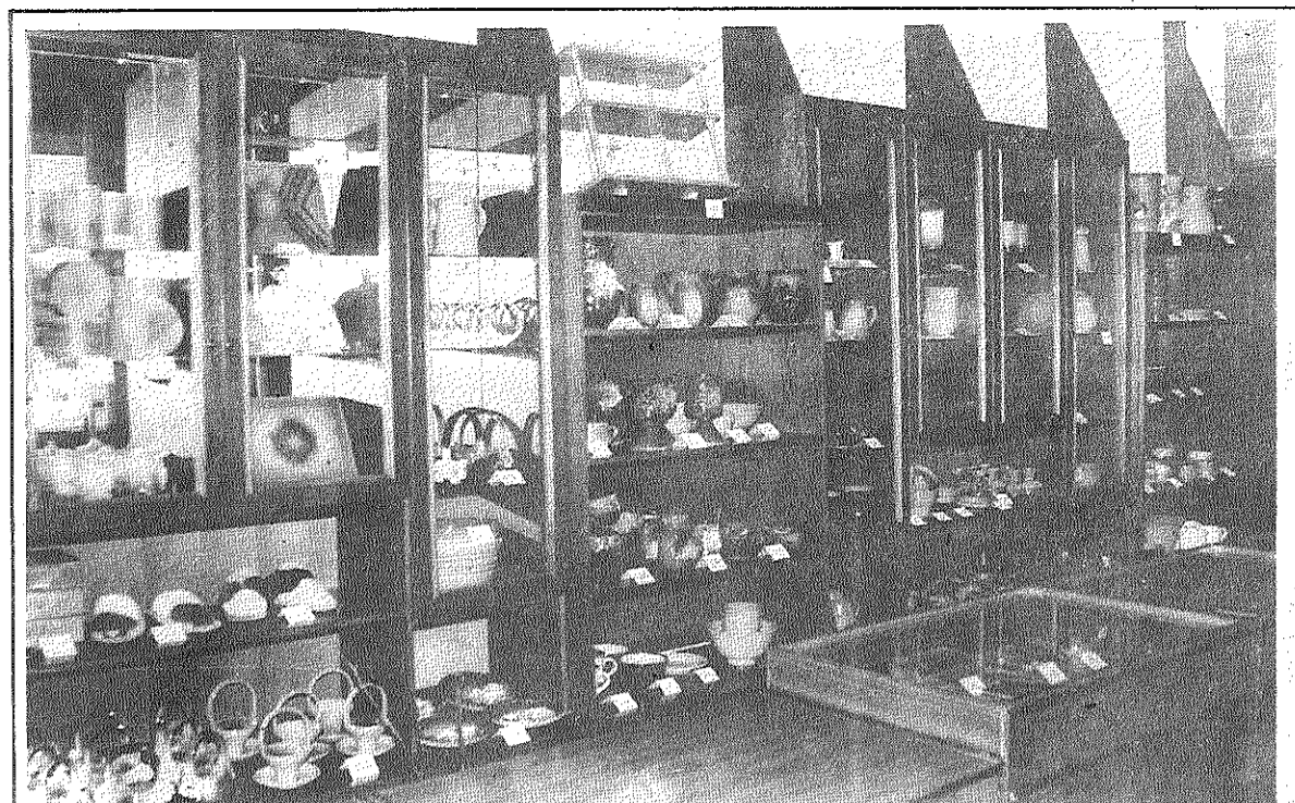
■ Livānu universālveikala suvenīru nodaļa pircējiem allaž piedāvā plašu preču klāstu.