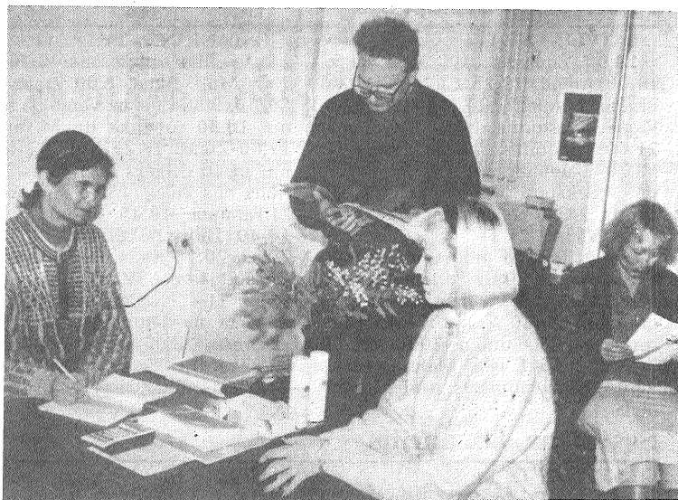
Salonā «Lana» ieradušies apmeklētāji.

Aparatūru nav ieteicams izmantot grūtniecēm un sievietēm drīz pēc dzemdībām, slimniekiem ar paaugstinātu ķermeņa temperatūru, infekcijas slimībām, diabētiķim, erabolijas un aterosklerozes slimniekiem. Visai uzmanīgi «ULTRA-SLIM» jāizmanto sirds slimniekiem un cilvēkiem, kuriem ķermenī atrodas metāliski priekšmeti, tas ir, dažādas protēzes kaulu nostip-