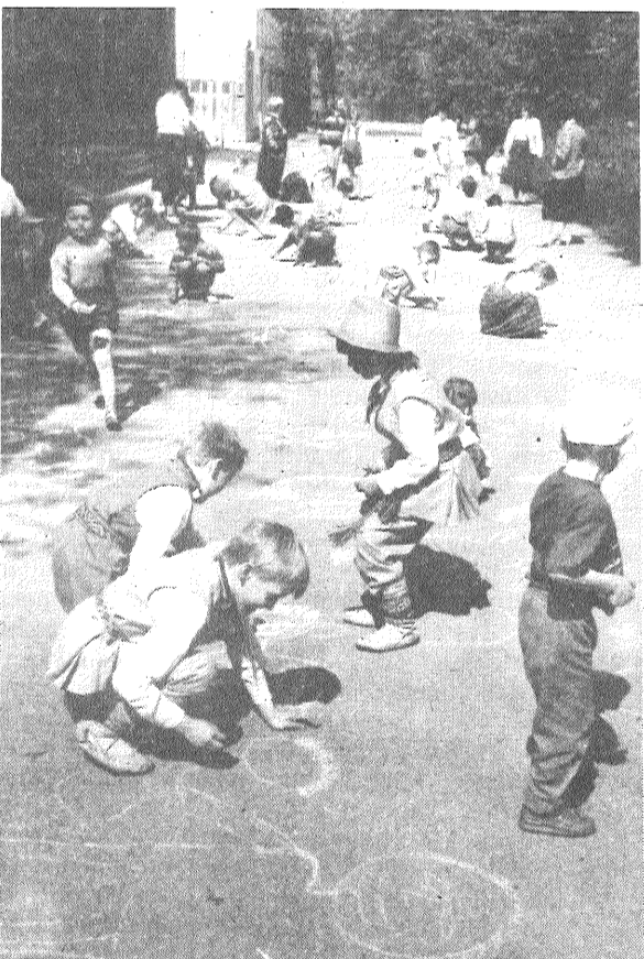
■ 1. vidusskolas labākie zīmējumi par tēmu «Mana ģimene» bija redzami izstādē. Visi pārējie varēja pievienoties sarīkojuma laikā. Vienīgi jaunradei bija īss mūžs. Bērnu zīmējumus uz asfalta pēc stundas noskaloja auglīgais pavasara lietus.