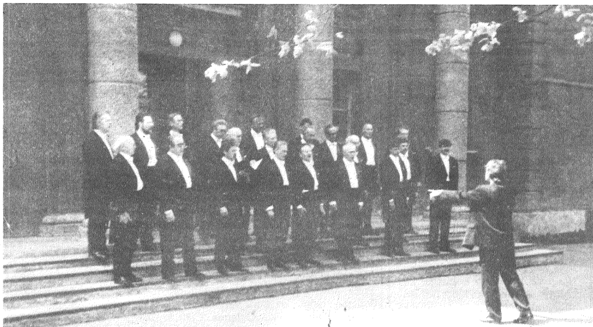
■ Klasiski tērptais melnbaltais vīru koris «Dziedonis» un tulpes vāzē uz kultūras nama kāpnēm, tas izskatījās tik labi, ka šo ainu gribējās ierāmēt un piekarināt kā gleznu mājās pie sienas.