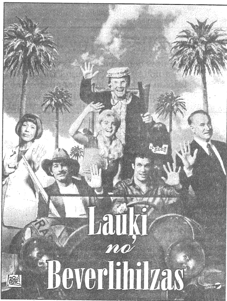
6. un 7. jūnijā kinoteātrī «EZERZEME» plkst. 17.00, 19.00, 21.00.

Ceļotāju klubs. 16.25 Teniss. 17.15 Ziņas. 17.25 Augstākās aprindas. 17.40 Spikeris. 17.45 Mult. filmas. 18.40 TV locis. 18.55 Kāds būs laiks? 19.00 Jautro un atjautīgo klubs. 21.00 Svētdiena. 21.45 Sportiska ne-dēļas nogale. 22.00 Dzeja. Veltīts Puškinam. 22.20 Delijas strupceļš. Mākslas filma. 23.00 Ziņas. 23.10 Briesmīga Fremisa. Mākslas filma. 23.45 Teniss.