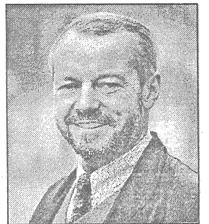
Joahims Zigerists : Latvijas cerība

Saeimā rakstiski apliecināja, ka nekad nav sadarbojušies ar VDK. 5 no 100. Taisni jāsmejas. Protams to ir vairāk. Tas man bija skaidrs jau no pirmās minūtes. 5 - tā ir tikai aisberga virsotne. Tikai pieci ir atmaskoti. Bijušie VDK līdzstrādnieki vai vecie komunisti. Šodien katrs mūsu valstī zin, ka viņi ir ielavījušies visās partijās. Bēdīgi, bet fakts: visā Latvijā nav nevienas partijas, kurā nebūtu bijušie komunisti. No LNNK līdz Latvijas Ceļam. Nekādas atšķirības. Es gribu jums izklāstīt, kādēļ es pilnīgi apzināti un atklāti boikotēju šo parlamentu: