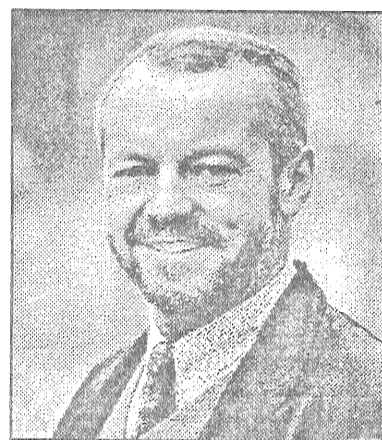
Zīgerists grib glābt Brīvības pieminekli.

Sākotnēji es tam nevarēju un pat negribēju ticēt - bet tiešām tā ir: Brīvības piemineklim draud briesmas. Pamati ir nestabili un nobrūk arvien vairāk. «Skābais lietus» un kaitīgas vielas gaisā turpina iedarboties postoši uz akmens plāksnēm un bojāt pieminekļa tēlus. Eksperti man pateica skaidri un gaiši: ja netiks uzsākti pamatīgi un nopietni restaurēšanas darbi, patiešām var pienākt brīdis, ka Brīvības piemineklis varētu sabrukt. Tas taču ir tīrais ārprāts: vai patiešām mūsu acu priekšā - bez varas pielietošanas - notiks tas, kas pat komunistiem un padomju varai ilgajos apspiestības gados nav izdevies? Sabrucis Brīvības piemineklis pašā Rīgas sirdī? Cik šaušalīga doma! Manā izpratnē tā būtu ļauna zīme. Ko par Latviju domās visas pasaules kultūras cilvēki, ja mēs tagad neiedarbinātu visas sviras, lai izglābtu Brīvības pieminekli?