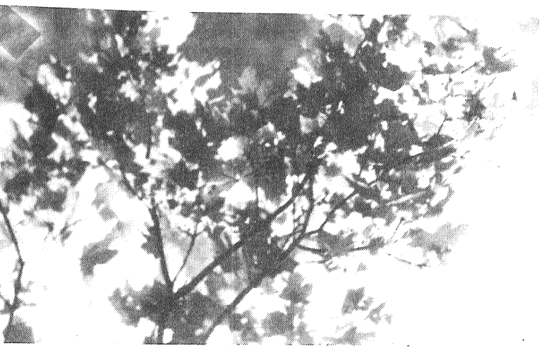
• Nak rudens izgleznot Latviju...