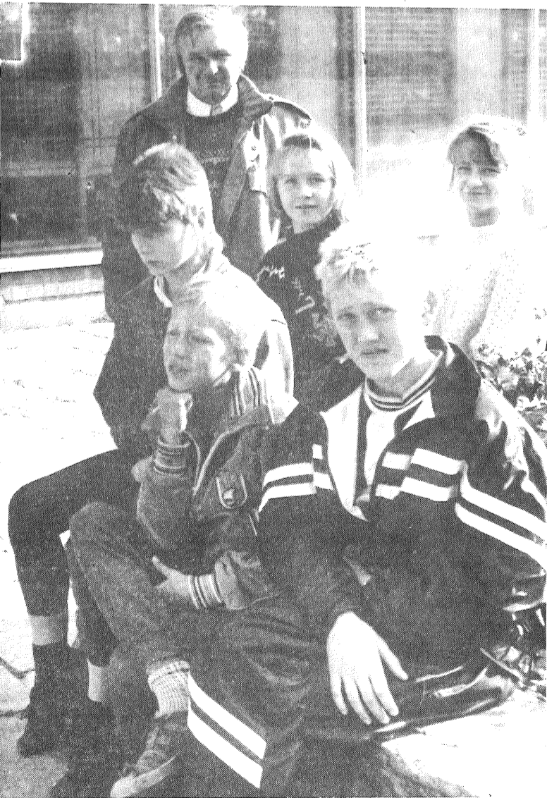
Galēnu pamatskolas soļotāju komanda un viņu treneris.