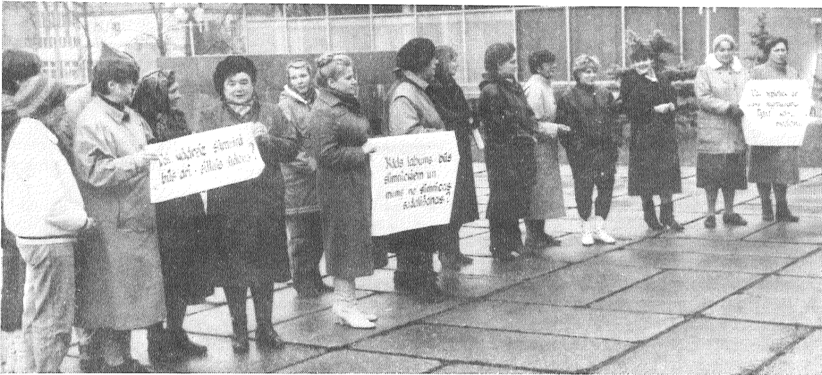
■ Rajona padomes deputātus pirms sēdes sagaidīja piketētāji – medicīnas darbinieki.

Kārtējai rajona padomes sēdei, kas šoreiz nenotika tradicionālajā trešajā trešdienā, bet 27. oktobrī, bija piedāvāti gandrīz divi desmiti dažādu darba kārtības jautājumu. Tā kā daži no tiem prasīja plašas debates, frakciju apspriešanas, laiks ievilkās un sēde tika pārtraukta līdz 11. novembrim.