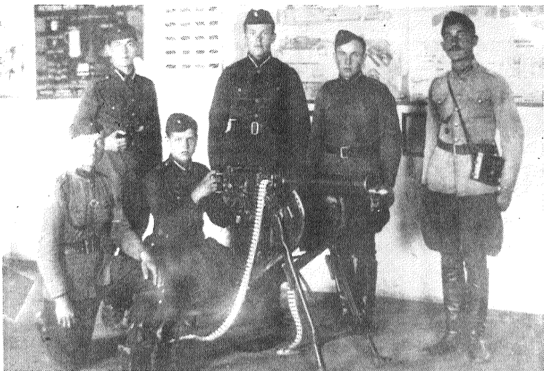
■ Latvijas armijas Dobeles 11. kājnieku pulka artilērijas divizionā karavīri Daugavpilī cietoksnī (1929.g.).

Nupat aizvadīto Lāčplēša dienu atzīmējot un Latvijas neatkarības gadadienu sagaidot, rajona kultūras namā atklāta izstāde «No zobena saule lēca», ko sagatavojis Preiļu vēstures un lietišķās mākslas muzejs. «Jauns laiks ir, un mēs gribam runāt. Vai mūs dzirdēs starp partiju kliezniekiem, no kuriem skan visas malas. Vai šīnīs dienās vairs kāds grib klausīties uz klusām un vienkāršām domām? Mēs negribam ne mācīt, ne tiesāt. Mēs gribam kalpot domām, kas var vienot tautu.» Nemeklēsim zemtekstu šiem K.Skalbes vārdiem, ko izstādes rīkotāji ņēmuši par vadmotīvu. Jo 1994. gads vairs nav 1989. gads. Vieni ir pārstājuši baidīties. Citi joprojām nevēlas nosaukt savus uzvārdus. Vien klusuciešot nesuši uz muzeju fotokartītes ar ļaužu grupiņām un teikuši, ka to vidū ir arī viņu tuvinieki.