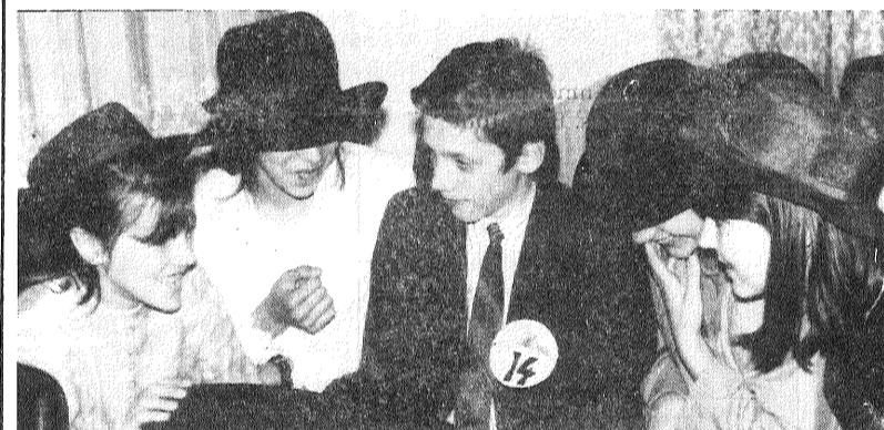
■ Apspriežas Aglonas ģimnāzisti.

Ne gaidīti daudz komandu — no 19 rajona skolām — bija pieteikušas uz Preiļu jaunrades centra rīkoto konkursu «Saknes meklējot». Žūrijai, komandām un to pavadītājiem — vēstures skolotājiem tikko pietika vietas mūzikas skolas zālē, kur konkurss notika.