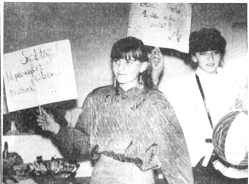
■ Preiļu 1. vidusskolas komandas piketētājas.