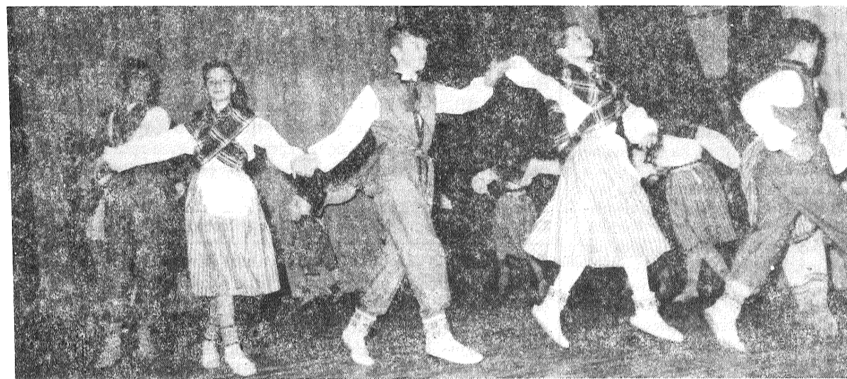
■ Pagājušajā sestdienā notika sadziedāšanās starp Preiļu rajona skolotāju kori un Daugavpils rajona skolotāju kori «Latgale». Pasākumu kuplināja Preiļu 1. vidusskolas dejotāji. Attēlos: dzied «Latgale»; uz skatuves Preiļu 1. vidusskolas dejotāji.