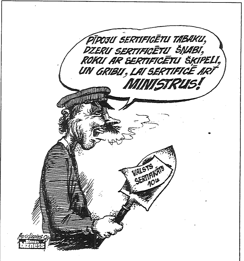
• 1994. gada nogalē Ministru kabinets pieņēma lēmumu par lauksaimniecības tehnikas sertifikāciju. Kaut nu paspētu līdz pavasarim, citādi zeme būs jārušina ar pirkstu... Agra Liepiņa zīm. («Dienas biznesa» karikatūru nodaļa)

No laikrakstiem «Diena», «Neatkarīgā Cīņa»