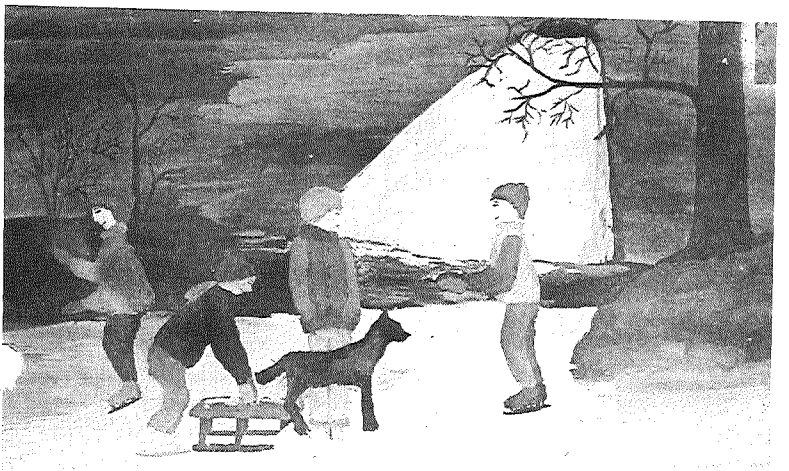
Daudziem izstādes apmeklētājiem patika Preiļu 1. vidusskolas 7. klases skolniece Agneses Līvmanes akvarelis.