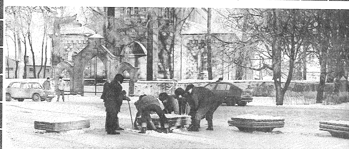
Neparasta rosība otrdien no rīta valdīja Preiļu pilsētas centrā. Vīri krāva no traktora piekabes un lika uz ielas puķu podus. Vai tiešām mīnus desmit grādu salā būs iestājies sniegpulkstēniņu laiks?

saviem darbiniekiem maksā regulāri, bet gan Preiļu siera rūpnīca, turklāt nevis attiecībā uz algu izmaksām, bet gan — par samaksu piena piegādātājiem no Riebiņu pagasta. A/s «Preiļu siers» arī Riebiņu pagasta piena piegādātājiem, tāpat kā visur, par nodoto pienu nav maksājusi jau vairākus mēnešus.