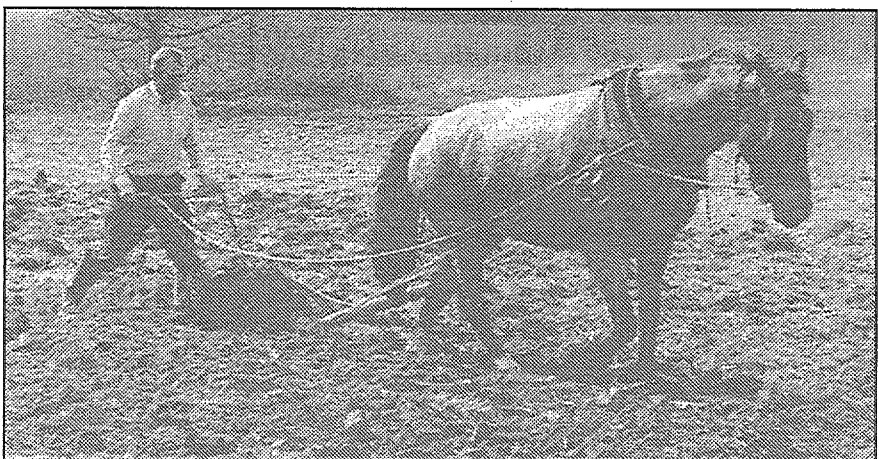
● Kam 5 - 6 hektāri aramzemes, tam lietā jāliek zirgs...

jo nebija ticības, ka graudus varēs pārdot, tālab daļa lauku palika neapsēta. Protams, zemi uzar tagad un rocīgākie var paspēt daudz izdarīt.