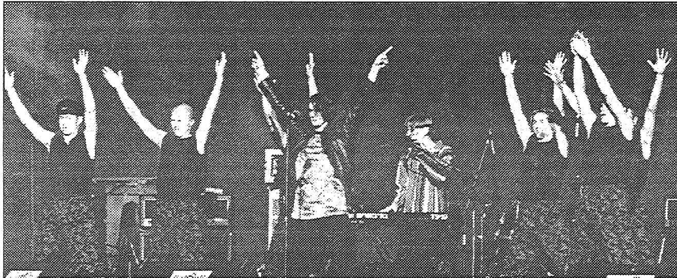
Grupa 100. Debija.

«Mikrofona» preses centrs turpina «Novadnieka» lasītājus iepazīstināt ar jaunumiem MicRec un citu latviešu ierakstu studiju produkcijas klāstā, aktualitātēm latviešu mūzikā un jaunajām programmām.