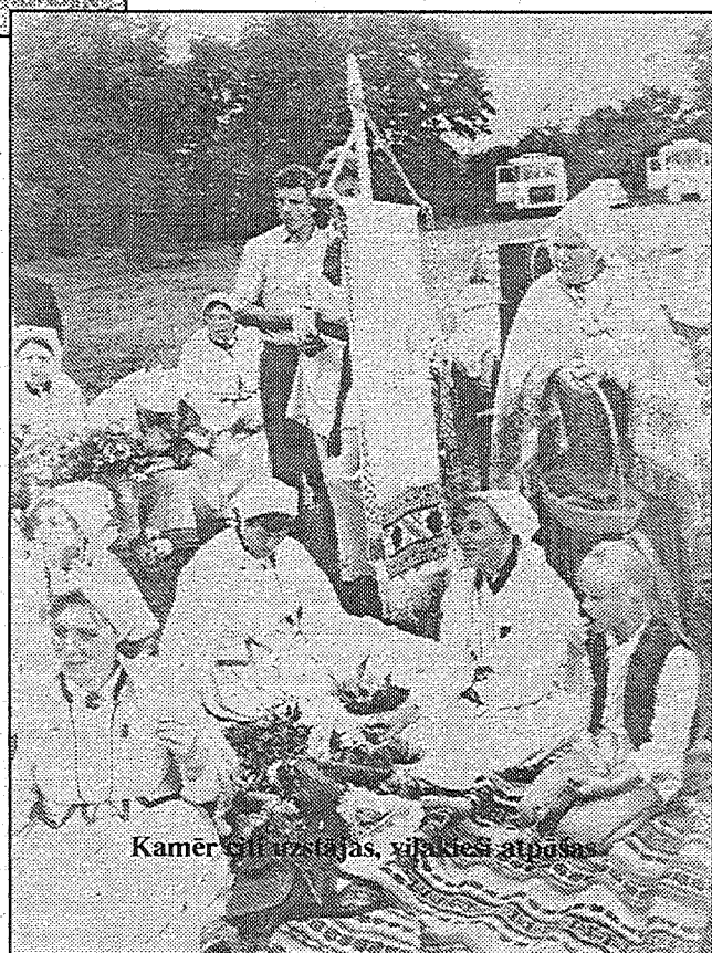
Kamēr gli uzstājas, viļānieši atpūšas