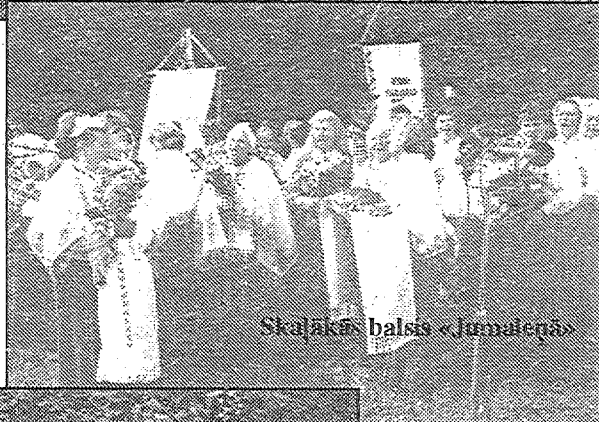
Skatītāja balsis «Jumalēnā»