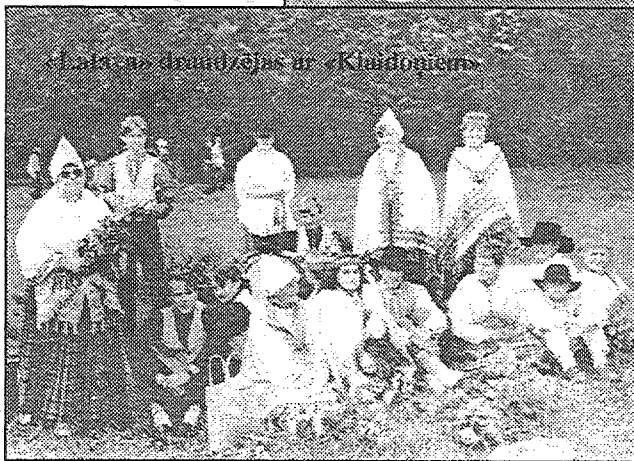
«Latavas» draudzības ir «Klaidoņiem»