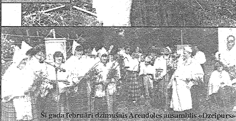
Šī gada februārī dzimušais Arendoles ansamblis «Dzeipurs»