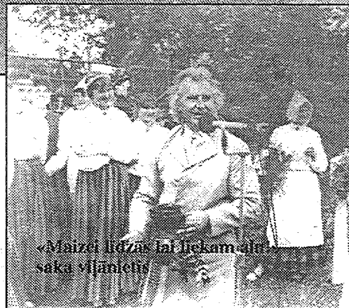
«Maizei līdzās lai liekam alu» saka viļānietis