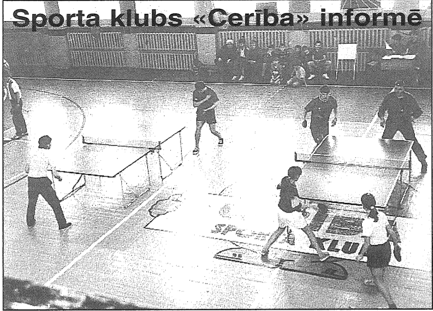
Sacensības galda tenisisti.

◆ Basketbols. Turpinās Latvijas čempionāts 2. līgas komandām. Kārtējās spēles aizvadījuši Preiļu SK «Cerība» un Līvānu BK basketbolisti. Preiļos tikās abas mūsu rajona komandas un spēcīgāki izrādījās Līvānu basketbolisti 78:13. Pēc tam līvānieši piedzīvoja zaudējumu Olainē 64:70, bet preiļieši ļoti nervozā spēlē prata pieveikt Cēsu komandu 77:71. Lai kam jau šī spēle no mūsu basketbolistiem prasīja pārāk lielu spēka patēriņu, jo Gulbenē preiļieši dabūja pamatīgu pērienu 68:126. Pagaidām turnīra tabula izskatās šāda: