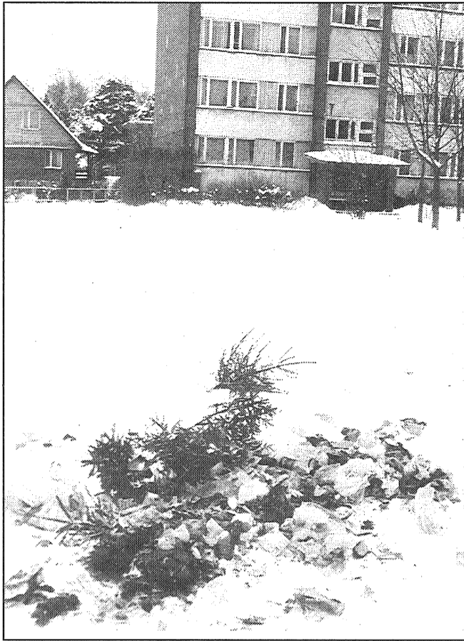
Līvānos dzīvo daudzi sūnciemi, kuri savus mēslus regulāri izliek, lai cilvēki tos varētu aplūkot. Labi jau būtu, ka maksas noteikšana par atkritumu izvešanu uzlabotu ne tikai DzKSU finansiālo stāvokli, bet palīdzētu arī sūnciemiem kļūt par cilvēkiem.

— atrodot sadzīves atkritumu čupās kādus dokumentus, kas apliecina to piederību, tiek sastādīts akts, kurš tiek nodots pilsētas domes administratīvajai komisijai. Šādi akti jau tikuši sa-