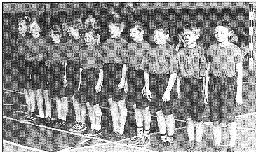
Vārkavas vidusskolas komanda — uzvarētāja tautas bumbas sacensībās.