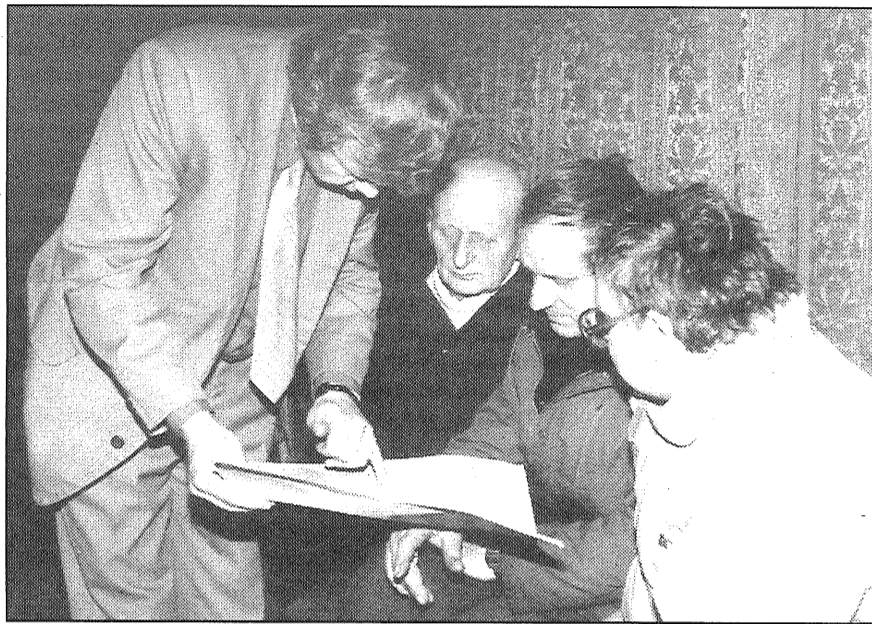
Vieta, kur celt celulozes monstru, šodien skatāma tikai kartē, tāpēc daudzi pat nenojauš, cik kardināli šāds uzņēmums izmainīs mierīgo pagasta dzīvi, ja tiks uzcelts.

Attīstības plānošanas nodaļā ir izveidota karte, kur rajona teritorija sadalīta zonās (rūpnieciski izmantojamā, lauksaimnieciski izmantojamā utt.), tāpēc lauksaimniekiem par savu saimniecību izmantošanu perspektīvajiem plāniem būtu jāinformē rajona attīstības plānošanas nodaļa.