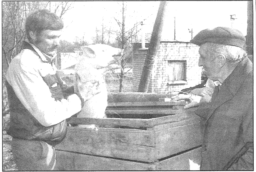
Pirms Staru Pēteris (no labās) šo ruksi pārdeva par 20 latiem, sivēns paguva nofotografēties. Tā jau saka — cūkai cūkas laime.

□ Labi pazīstama pagasta iedzīvotājiem ir arī firma «Dzīpars» no Viļāniem ar savu produkciju — austām gultas segām, pārklājiem, aizkariem, dvieļiem, galdautiem un citiem izstrādājumiem, arī adījumiem. «Rožupē tirgojam nepilnus 3 gadus, atbraucam reizi pusotrā mēnesī. Cilvēki mūs gaida un labprāt pērk mūsu produkci-