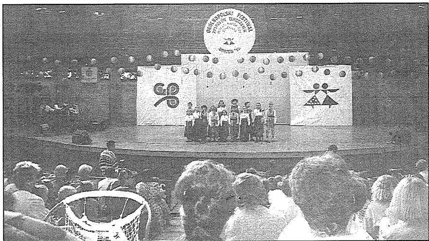
«Ceiruleiša» uzstāšanās Gorzovas festivāla noslēguma koncertā.

17.06. No rīta mūsu draugi aicināja visus kultūras namā, kur bija uzklāts galds, — saldējums, sulas, limonāde, cepumi. Šis Gorzovā