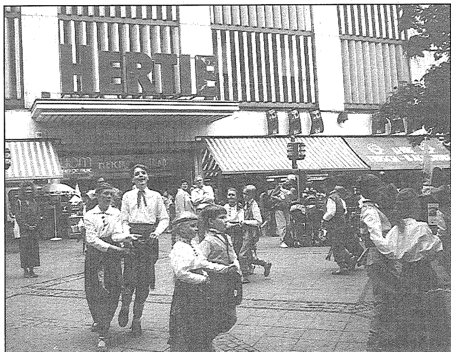
Latviešu folkloras «cīruļēnu» sniegumā Berlīnes ielās.

pavadītās dienas mums visiem paliks atmiņā kā neaizmirstamas un jaukas. Vēl apmainījāmies suvenīriem, tad pēdējās bučas, un jāšķiras. Bet asaras vēl ilgi nerimās, jo bijām ļoti saraduši.