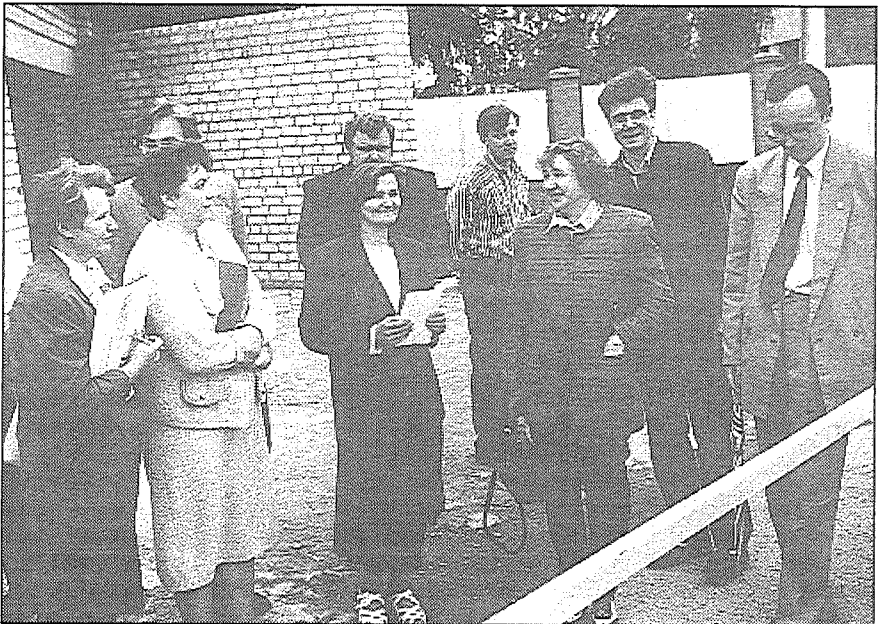
Žūrijas komisija iepazīstas ar sporta kluba «Cerība» bāzi.

◆ Pēc rajona padomes iniciatīvas šogad notika konkurss «Par sakoptāko pilsētu». Žūrija vērtēja pilsētu domes ēku, pašvaldības uzņēmumu, ielu un dzīvojamo masīvu, individuālo dzīvojamo māju, attīrīšanas iekārtu, kultūras un sporta iestāžu, piemiņas vietu sakoptību.