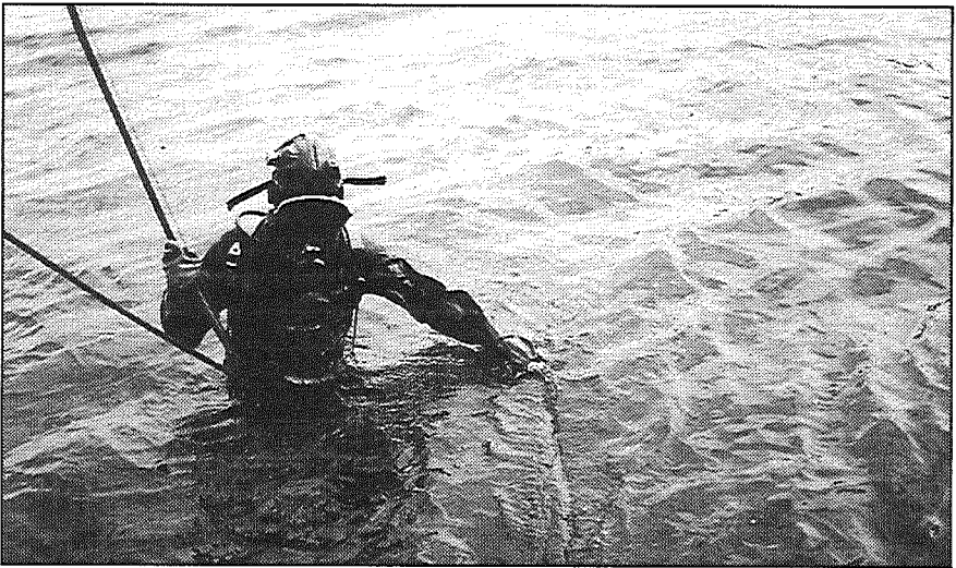
Attēlā redzamais ūdenslidējs tikko zem ūdens pārzāgējis pamatīgu balķi.

Par rajona līdzekļiem nopirkta liela motorlaiva, viena glābšanas laiva, divi laivu motori, divas lielas bremzētas teltis, kuras var izmantot stihisku nelaimju gadījumos, kā arī kompresors. Īsi pirms zviedru atbraukšanas tika nopirkts arī motorzāģis Jonsered, kā arī metāla un betona griezamā mašīna.