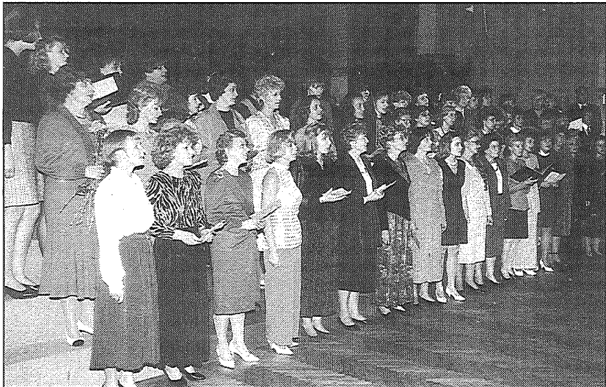
◆ «Kur skrējienā vienojas upes...». «Skolas dziesmu» dzied Līvānu 1. vidusskolas skolotāju «zvaigžņu koris».

Jau atpakaļ ikdienas ritmā atgriezies dzīve Līvānu 1. vidusskolā, bet daudzu jauku cilvēku laba vēlējumi un dāvanas vēl joprojām atmiņām liek kavēties pie 12. oktobra, — dienas, kura Līvānu skolai bija svētki.