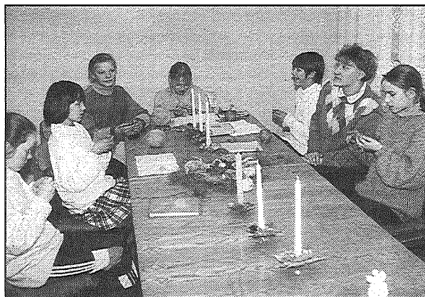
Materiālus par Vārkavas pagastu sagatavoja Aina Iljina

◆ Dažādas praktiskās rokdarbus apgūst Vārkavas pamatskolas meitenes — mācās adīt, tamborēt, šūt. Darb-mācības nodarbības vada skolotāja Diāna Stubure. Attēla: 5. un 7. klases meitenes mācās tamborēt. Viņas gatavoja arī Ziemassvētku rotas skolas noformēšanai.