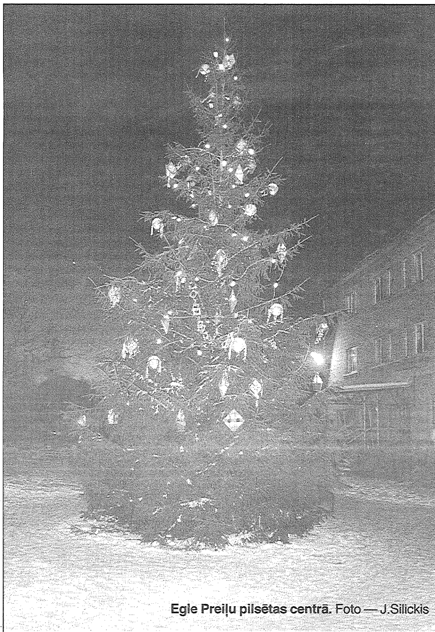
Egle Preiļu pilsētas centrā.

Agrākos laikos Adventes vainagā lika 23 sveces, jo Advente ilgst 23 dienas.