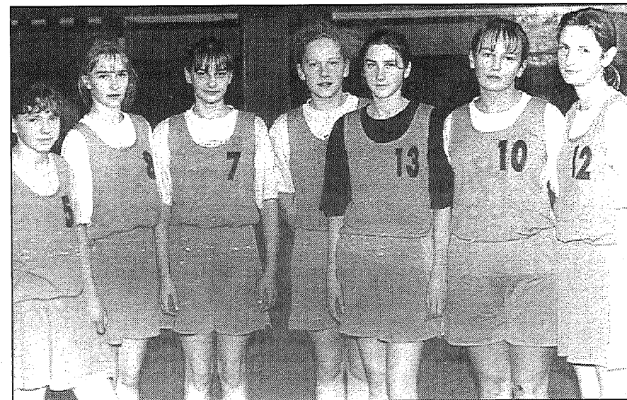
● Preiļu 1. pamatskolas basketbola komanda.