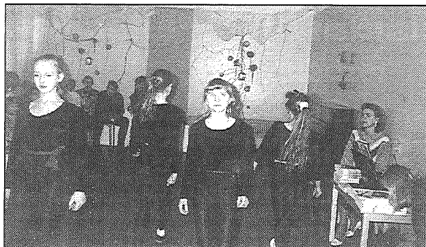
◆ Uz vienu no jaunrades nama sarīkojumiem uzaicināti pilsētas mazie invalīdi.