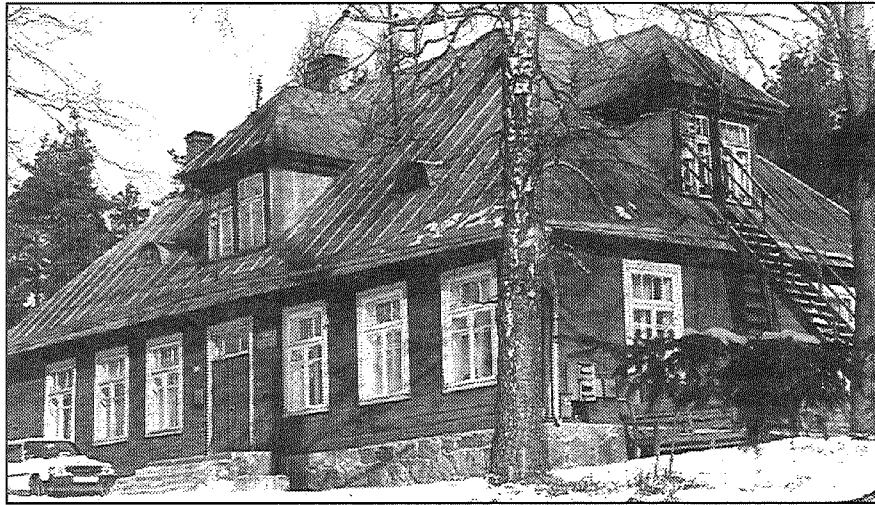
● Aglonas lauku slimnīca.

Divas reizes gadā, pavasaros pēc sējas un rudenos pēc ražas novākšanas, statistiķi laukos veic darbaspēka izlases apsekojumu un lauku saimniecību apsekojumu. Tas arī ir vienīgais informācijas avots, lai zinātu, kāda tad īsti ir situācija laukos, ko par