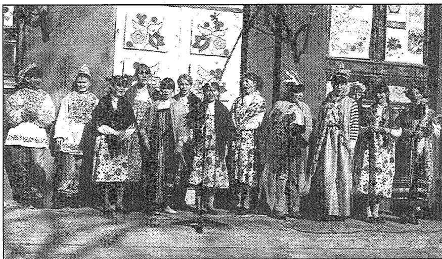
● Dzied krievu tautas dziesmu ansamblis, ir ieradusies Saule un citi tēli.

Tirdziņā notika rošīga tirgošanās ar skolēnu darinājumiem, ar dažādiem sīkumiem, ar saldumiem. Skolas bērniem līdzī bija atnākuši arī vecāki, vecvecāki, un viena otra vecmāmiņa mazbērnu cienāja bagātīgi, kā pēc tradīcijas pienākas. Skaņēja mūzika, skolēni varēja piedalīties dažādās spēlēs, atrakcijās, loterijā, darbojās «laimes akā». Arī šogad, tāpat kā iepriekšējos gados, bērni varēja vizināties zirga pajūgā. Šo