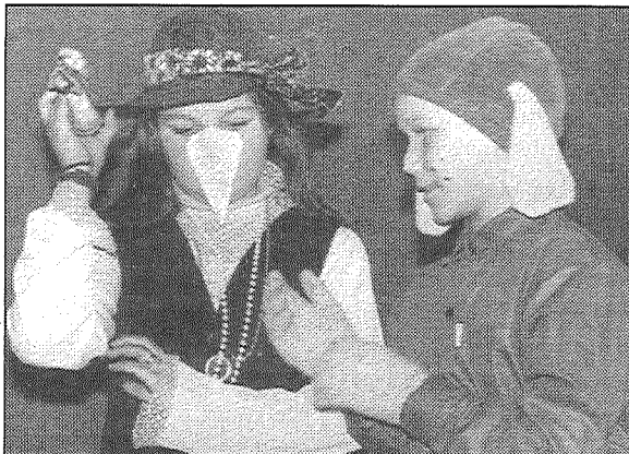
● Uzstājas Gailiņu pamatskolas skolēni.