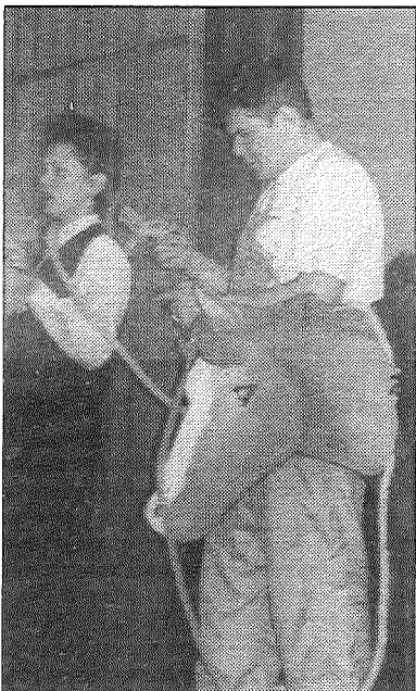
● Salas pamatskolas skolēni izrādē «Pilsētnieki laukos».