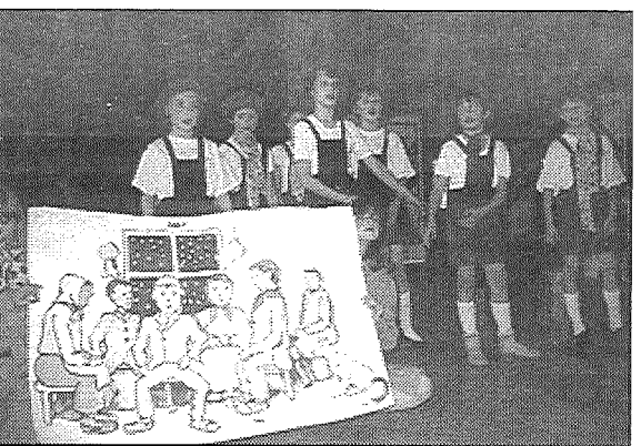
● Izrādes «Mazā ganiņa brīnišķīgie piedzīvojumi» ģenerālmēģinājums pirms skates Līvānu 1. vidusskolā.

ta Līvmane. Vecākā grupa ar izrādi «Kadrija» jau viesojusies Dravnieku, Siļukalna pamatskolās, izrādījusi pašu pagastā, bet mazajiem šī skate bija pirmā uzstāšanās ārpus skolas.