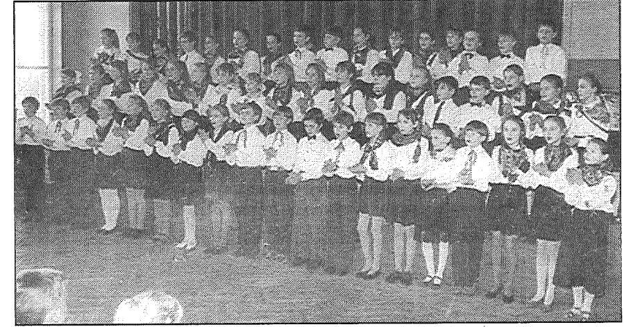
● Preiļu pamatskolas 4. klašu koris.

21. martā Līvānu 1. vidusskolā notika Preiļu rajona 2.-4. klašu koru festivāls. Rajona mūzikas skolotāju metodiskās apvienības vadītāja I.Balaško mazajiem dziedātājiem novēlēja skanīgas balsis un dzīvesprieku, un tālāk šī