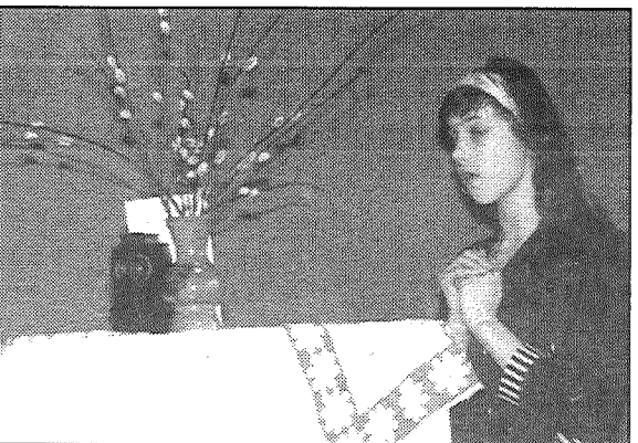
● Fragments no Jersikas skolēnu sagatavotās izrādes «Trīs meitenes».