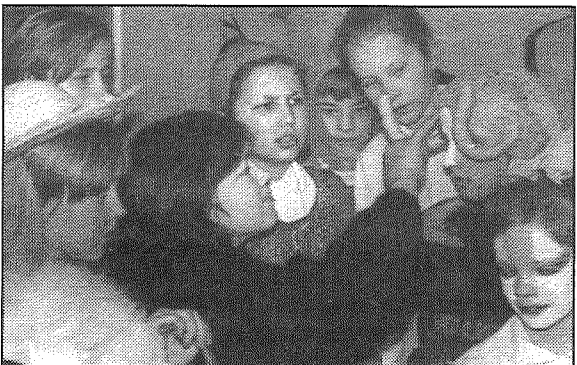
● Pirms izrādes grimējas Rudzētu vidusskolas mazie aktieri.