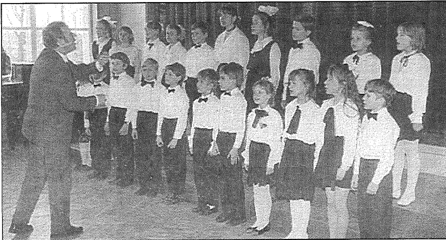
● Dzied laureāti — Rudzātu vidusskolas 2. — 3. klašu koris un...