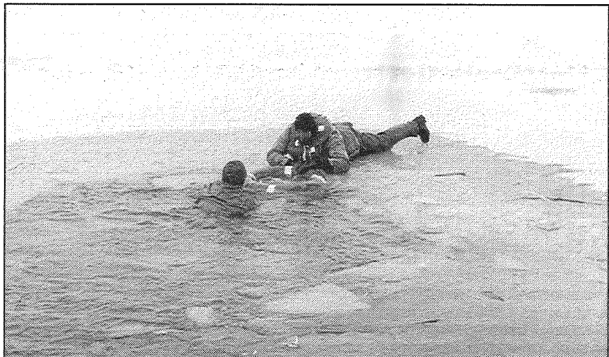
▼ «Cietušā» izvilšana no āliņģa ar glābšanas riņķa palīdzību, starp citu, «cietušajam» hidro-kostīmā ledainajā ūdenī nemaz neesot bijis auksti.

Kādreiz visai populārs bija teiciens, ka slicēju glābšana ir tikai pašu slicēju ziņā. Laiki iet, tikumi mainās un izrādās, ka tagad palīdzību var sagaidīt arī no malas. Par to var pārliecināties, ielūkojoties šajos fotoattēlos, kur redzami ugunsdzēsības un glābšanas dienesta vīri, kad viņi pagājušās nedēļas nogalē trenējās Vaivodu ūdenskrātuvē, kas atrodas Preiļu pagastā.