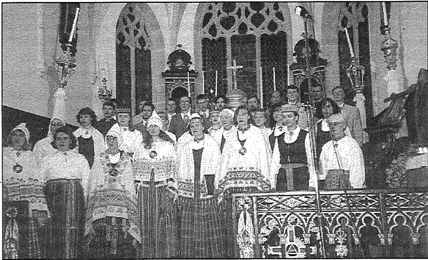
● Ar panākumiem, ko atspoguļoja arī Francijas prese, notika skolotāju kora koncertturneja pagājušā gada septembrī Francijā. Šeit koris uzstājas vienā no lauku ciemata baznīcām, viduslaikos celtā ēkā.