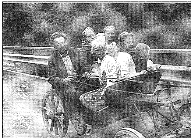
● Arī rati pāri tiltam ripoja labi. Un pēc pāris gadiem jaunajām meitām uz tilta būs viena varena randiņu vieta.

kilometrs brauciena autobusā viņiem izmaksā pusotru santīmu. Bet kravu pārvadājumi smagajās automašīnās izmaksā 25-28 santīmus kilometrā.