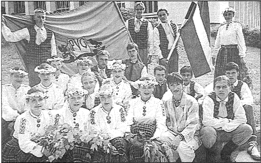
● Preiļu Valsts ģimnāzijas jauniešu deju kopa «Gaida» Utenā.

Ar gandarījuma izjūtu un gaišumu sirdī, kā apgalvoja paši dejojāji, no festivāla, kas no 9. līdz 12. jūlijam notika Utenā, atgriezies Preiļu Valsts ģimnāzijas jauniešu deju kopa «Gaida». Rosināju dalīties iespaidos, kā noritēja festivāls, kas visspilgtāk palicis atmiņā.