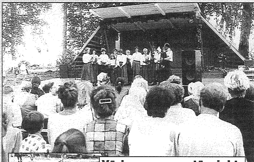
Vārkavas pagastā piekdien atklāja jauno estrādi. 2. lpp.