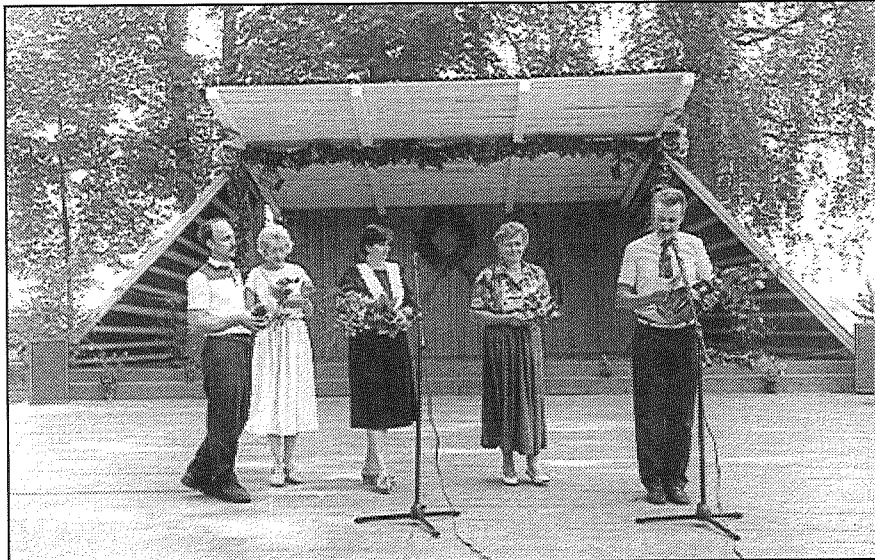
● Ar apsveikumiem ieradušies Sutru, Aizkalnes un Rožkalnu pagastu pārstāvji.

Izrādās, ka Latvija jaunu augu aizsardzības preparātu reģistrācijas un ieviešanas ziņā ir līderis, atstājot aiz sevis gan Lietuvu, gan Igauniju. Taču pielietojuma apjomu ziņā joprojām nevaram līdzināties ar Lietuvu. Šajā kaimiņu valstī augu aizsardzība ir 1989. gada līmenī (kā pirms kolektīvo saimniecību likvidācijas, kad augu aizsardzības jautājumus risināja nopietni un centralizēti). Latvijā