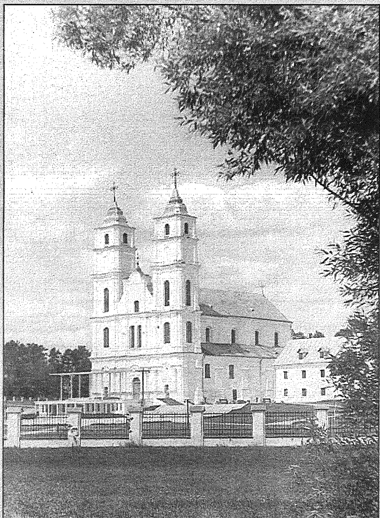
Parī Aglonā - Jaunavas Marijas Debesīs uzņemšanas lielie svētki.