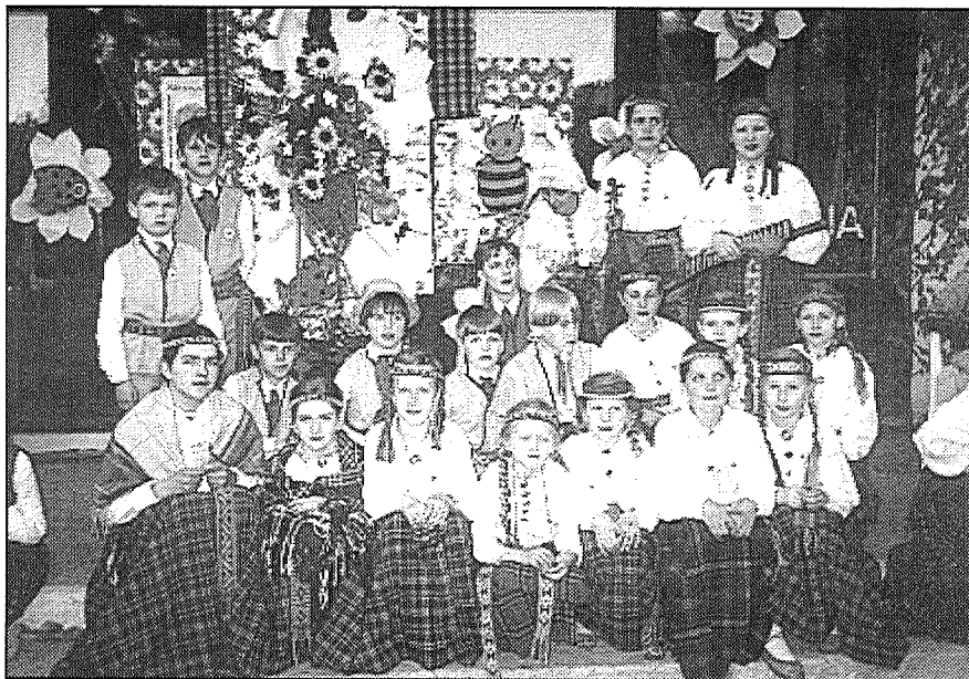
● «Ceiruleīts» festivālā «Pulkā eimu, pulkā teku».

Sēļu folkloras svētki «Neba maize pati nāca» Aknīstē 2. augustā iekrāsoja sesto