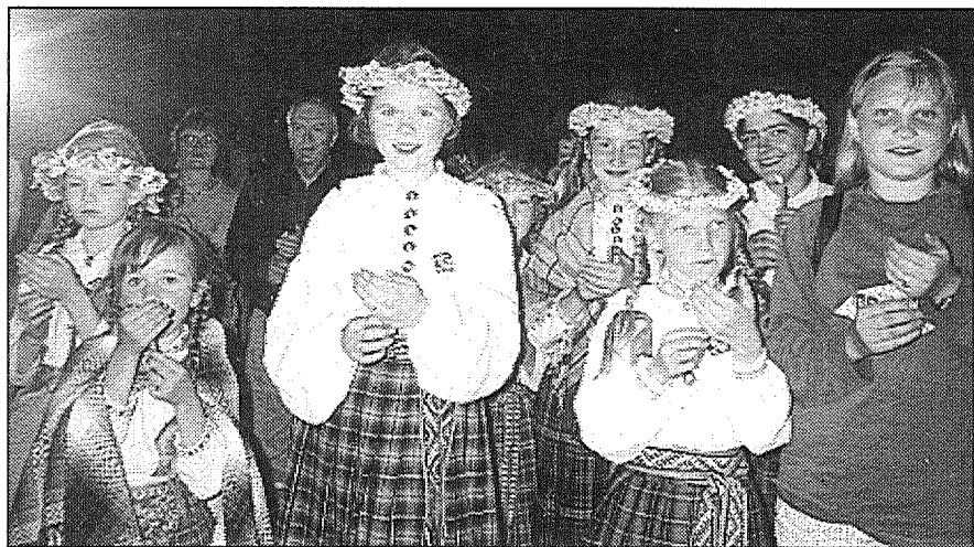
● «Visi ceļi gunīm pilni». «Ceiruleīts» «Baltica '97» atklāšanas koncertā.