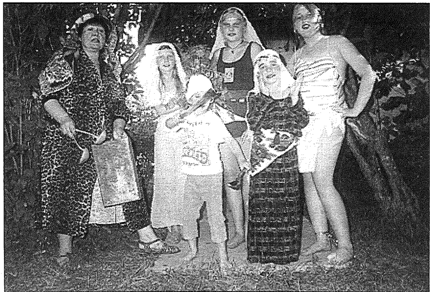
● Bērnu folkloras nometnē Vanagos.