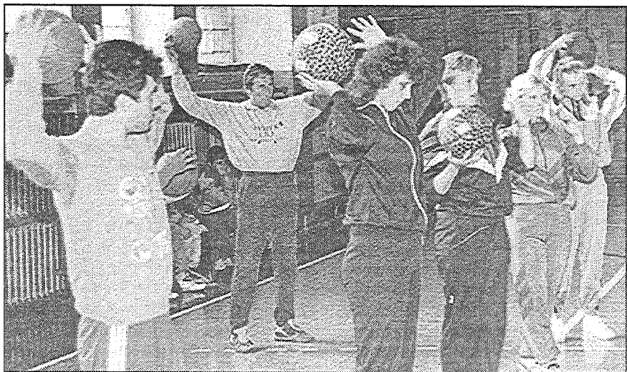
● Fizikultūras skolotāji praktiskajās nodarbībās — izspēlējot basketbola elementus.

— Neteikšu, ka daudz. Jo nu jau kādus divus, trīs gadus bērniem fiziskajā audzināšanā neliek atzīmes tikai par rezultātu, bet ļoti daudz uzmanības pievērš prasmei, tas ir, tehniskajam izpildījumam.