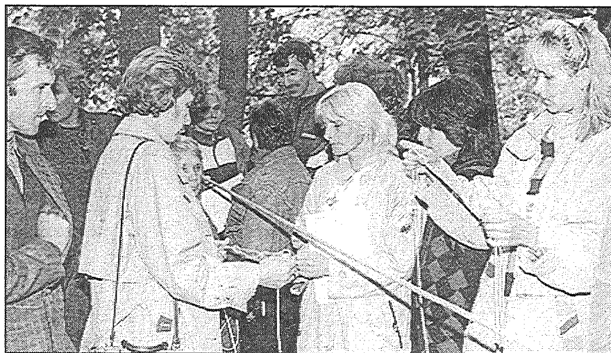
● Tūrisma sacensībās rudenīgajā Preiļu parkā.

Var būt fiziski vājāks skolēns, bet ļoti labi izpildīt basketbola elementu, to kombināciju. Fizikultūras ieskaite sastāv no divām daļām. Viena ir teorētiskās zināšanas un tehniskais izpildījums, bet otra ir skolēna spējas, fiziskie dotumi. Ne katram bērnam tie ir, vienam labāki, otram vājāki. Var jau, protams, uztrenēt, bet kaut kas ir iedzimts.