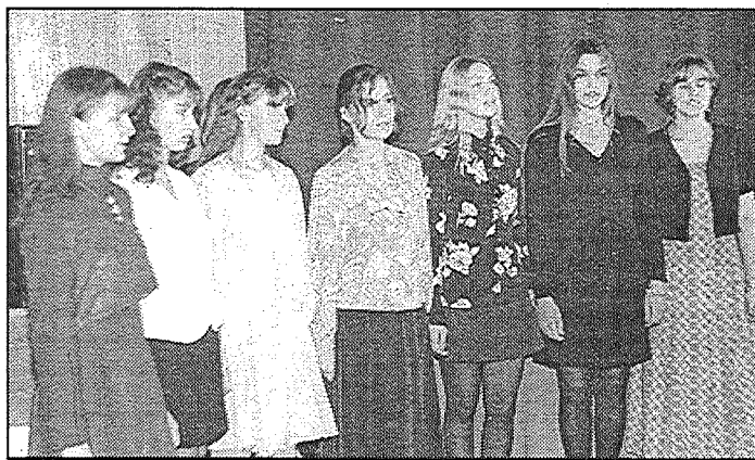
● Dzied ģimnāzijas ansamblis.

Preiļu Valsts ģimnāzija, uzņemot ciemiņus pie sevis, bija pa-