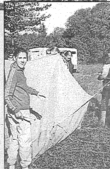
Preiļu Valsts ģimnāzija turpina no 1. vidusskolas līdzīgu paņemto tradīciju – katru gadu septembrī visai skolai rīkot tūrisma dienu. Pagājušajā piektdienā visi ģimnāzijas audzēkņi atkal ieradās pie Dovalas ezera.