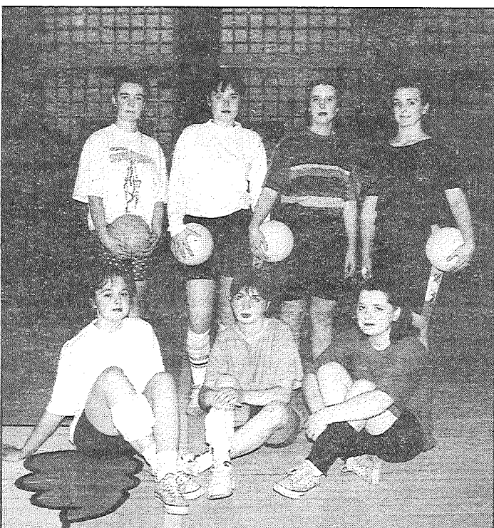
«Haoss» — studenšu, uzņēmēju, pedagogu un pārdevēju komanda.