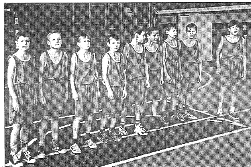
● Preiļū 1. pamatskolas pirmajai komandai tautas bumbas sacensībās trešā vieta.

Imants Babris, sporta kluba «Cerība» direktors