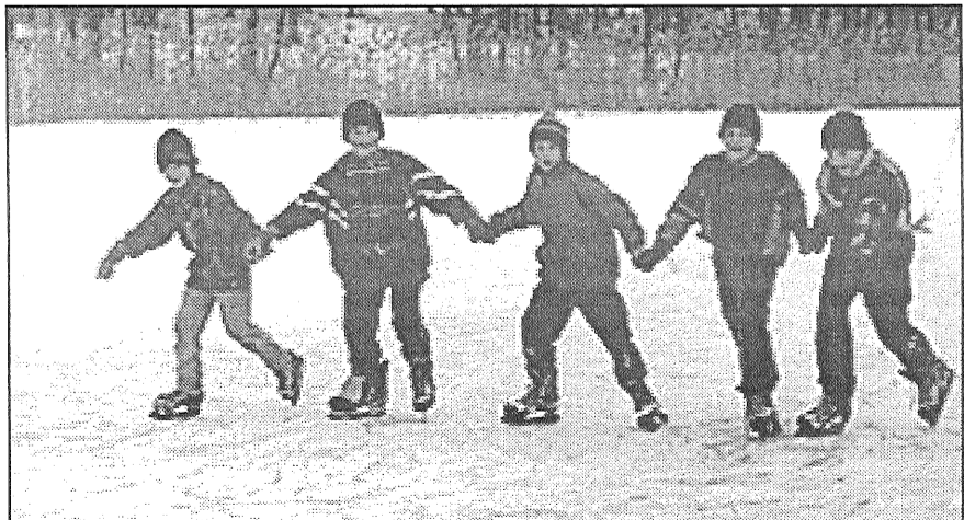
● Visiem vidusskolas bērniem ir slidas un arī vēlēšanās tās likt lietā.