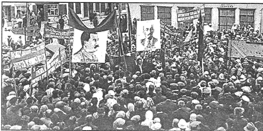
● Viens no 1940. gada mitiņiem Preiļos Tirgus laukumā. Starp sarkanajiem lozungiem un karogiem goda vietā Staļina un Ļeņina portreti.