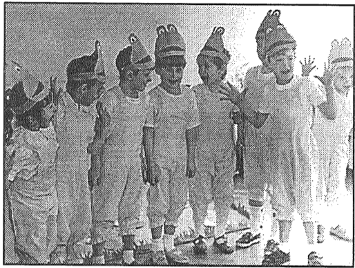
● Pavasara jaukie vārdulēni rāda izrādi Preiļu 1. bērnu darba.