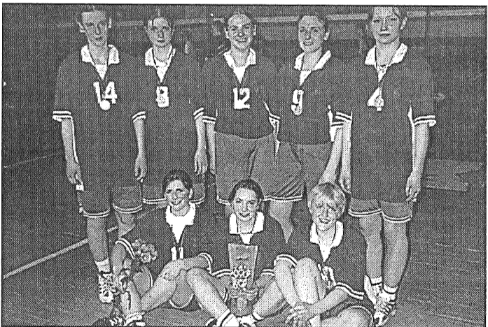
● Preiļu pilsētas basketbola čempionāta uzvarētāji: sieviešu komanda «Līvāni» un vīriešu komanda «1. vidusskola — Unibanka».