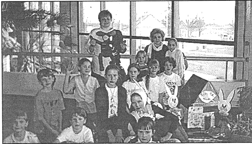
● Latgales daudzbērnu ģimeņu biedrības Preiļu nodaļu «Ģimenes Zaķa '98» salidojumā pārstāvēja septiņpadsmit bērni.

Pasākumā Zaķusalā piedalījās trīspadsmit grupas — no Viļķenes, Stopiņu, Skrundas, Verēnu, Viļānu, Laidu pagastiem, no Rēzeknes, Preiļiem, Aizkraukles, Rīgas pilsētas Centra rajona un Latgales priekšpilsētas. Bija ciemiņi arī no Klaipēdas, un izrādījās, ka Lietuvas Zaķiem ir tādas pašas tiesības un problēmas