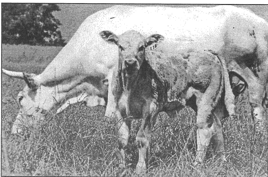
● Baltās gaļas šķirnes govīs «Blonde d'Aquitaine» ir ļoti lielas un ar labām gaļas īpašībām.