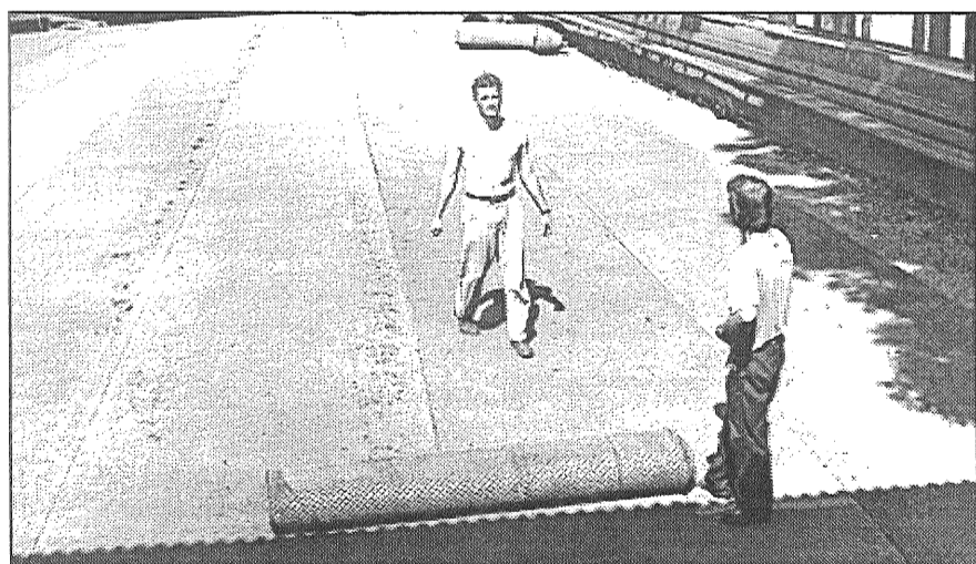
I Tenisa kortā jāpabeidz seguma klāšana.