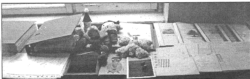
● Ideju tirdziņā skolotāji varēja iepazīties ar plašu materiālu klāstu.

Tikšanās noslēgumā skolas svinību zālē notika ļoti nenopietns «Vasarsvētku jampadracis», kuru atklāja visu skolu direktoru un viņu svītu uzrunas, kam sekoja metodisko komisiju sagatavoti priekšnesumi. Latviešu valodas un literatūras skolotāji rādīja priekšnesumu «Drāma kā metode latviešu literatūras stundās un teātrī». Vislielāko jautrību izraisīja matemātiķu un informātiķu piedāvātā spēle skolu direktoriem «Mini