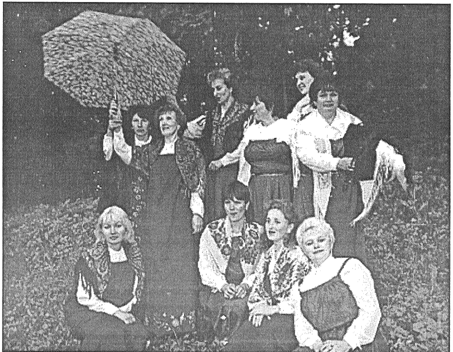
● Preiļu slāvu kultūras centra vokālais ansamblis «Rjabinuška». Tas saņēmis ielūgumu augustā piedalīties slāvu mūzikas un kultūras dienās Indrā.