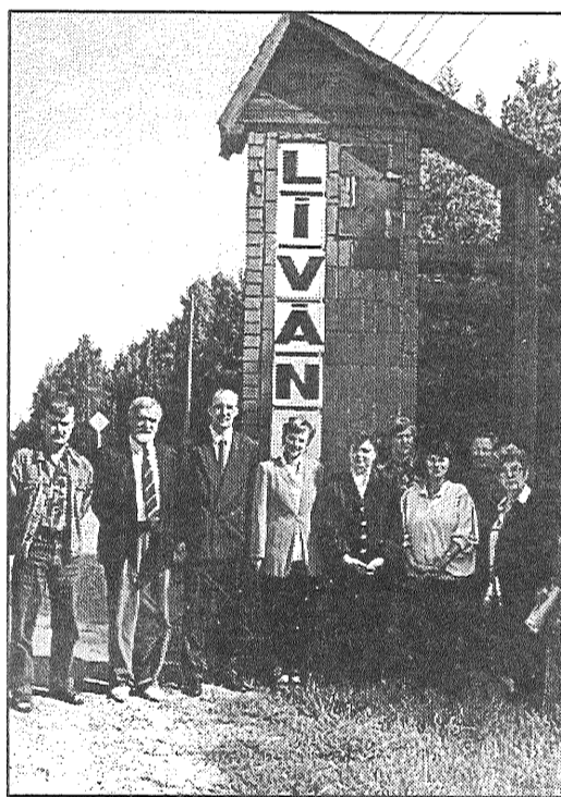
• Vērtēšanas komisija darbu Līvānos uzsāka, apskatot vienīgo pilsētas robežzīmi uz Līvānu — Daugavpils šosejas.