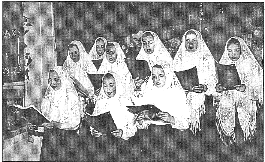
● Daugavpils vecticībnieku draudzes jauniešu koris dziedāja veclaičīgas dziesmas.