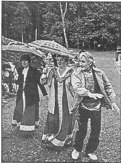
● Tā slāvu kultūras dienas lielākoties arī ritēja, — nezaudējot labu noskaņojumu par spīti lietum. «Ivuška» no Krāslavas.