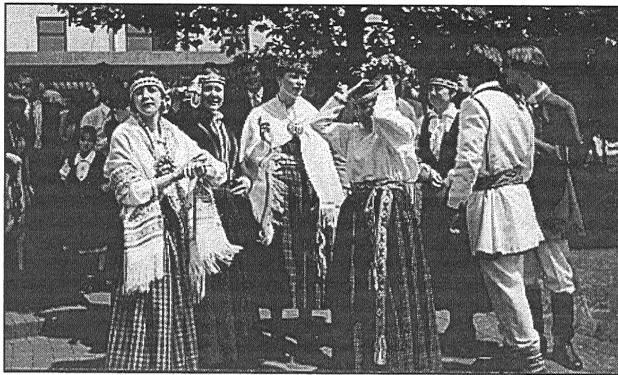
● MLĢ abiturienti gaida ierodamies pārējos klasesbiedrus uz izlaiduma svinībām 1998. gada 20. jūnijā. Pirmā no kreisās — raksta autore.

12. un 13. klasē skolēns nav ieinteresēts saņemt zemas atzīmes, jo četru pēdējo semestru rezultāti parādās gala apliecībā, kā arī nosaka vidējo atzīmi. Vācijā, atšķirībā no Latvijas, uzņemšanai universitatē netiek rīkoti iestājeksāmeni. Labākie pretendenti tiek atlasīti, vērtējot viņu vidējo atzīmi. Skolēnam Vācijā pārbaudes darbos ir