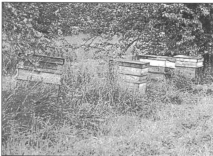
● Livmaņiem bišu stropi ir četrās vietās. Ja bite strādā meža tuvumā, tad ienestais medus ir tumšāks un veselīgāks.

— Sen pagājis tas laiks, kad no biškopības guvām lielu peļņu, kādreiz mājās bija tikai sunītis, nebija ne govys, ne arī citu lopu. Pārdevām medu un ziedputekšņus. Tas bija ļoti smags darbs — katru dienu nobraucām piecdesmit kilometrus un sezonas laikā gulēt gājām divpadsmitos, vienos naktī. Taču tam bija jēga, par nopelnīto naudu varējām tīri labi iztikt, arī savus bērņus izskolot. Tagad biškopība vairs neatmaksājas, neesmu vairs nekāds bitenieks, tikai tāds bišu turētājs. Pašlaik mums ir septiņdesmit stropi, izvietoti četrās vietās un daļa no tiem stāv tukši. Šovasar laika apstākļi neļāva bitēm aktīvi vākt medu, viņas vairāk domāja par spietošānu. Visus spietus nespējam saņemt, īpaši, ja spiets apmetas augstu