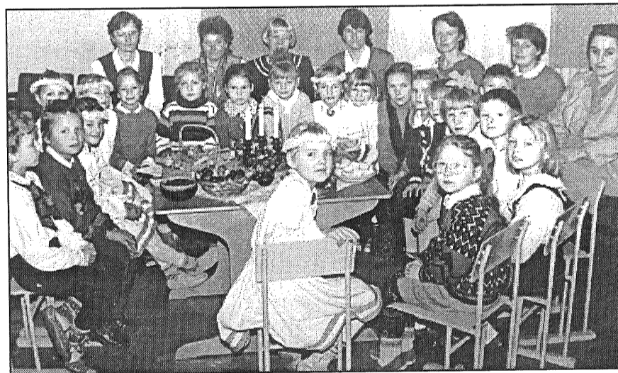
● Šādā draudzīgā pulciņā Dravnieku pamatskolā svinēti ne vieni vien svētki. Attēlā 1. klases skolēni ar vecākiem.

neēšanas dēļ. Bez tam tie skolas bērni, kas brauc uz sporta vai ārpusklases pasākumiem rajona centrā, saņem «komandējuma naudu» — 50 santīmus pusdienām un prēmijas par godalgotu vietu iegūšanu. Skolā sagādāti jauni soli.