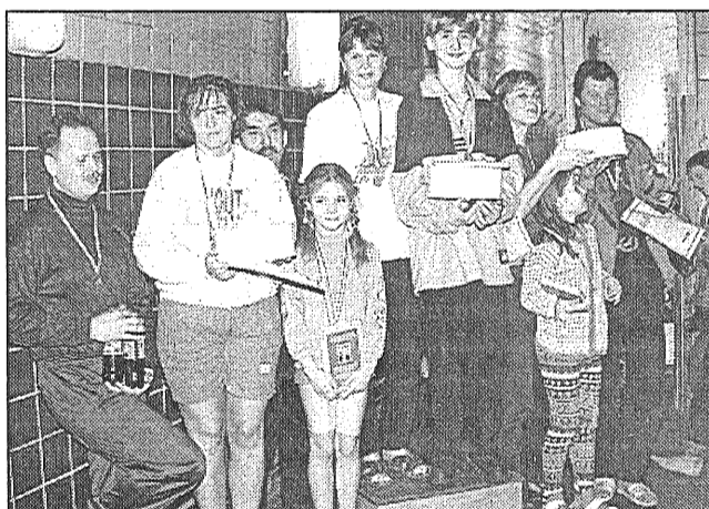
● Ģimeņu stafetes dalībnieki izpelnījās viskaļākos līdzjutēju aplausus. Pirmās vietas ieguvēji — Carjovu ģimene no Līvāniem, Orlovsku ģimene no Višķiem un Brokānu ģimene no Preiļiem.