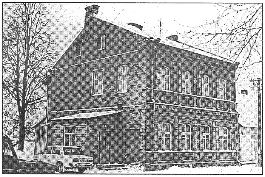
● Latvijas Krājbankas Preiļu filiāles ēka Brīvības ielā 7.

Kā ikviena banka, arī mēs veicam skaidras un bezskaidras ārvalstu valūtas konver-