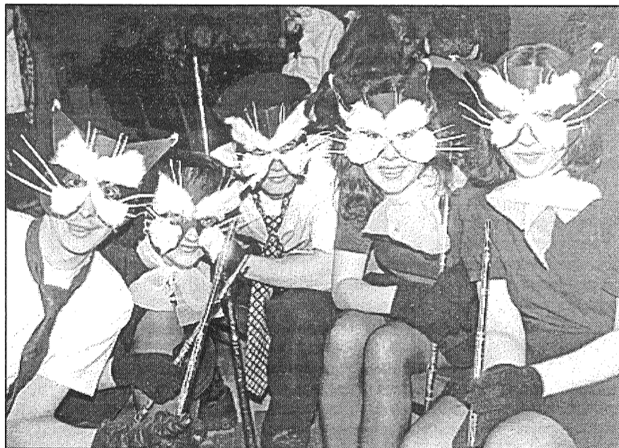
● Runči un kaķenes no Jersikas.