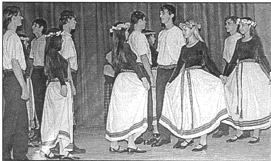
● Ar savdabīgiem tērpiem un interesantiem akcentiem koncertā izcēlās Preiļu Valsts ģimnāzijas deju kolektīvs.