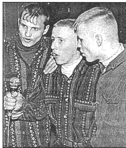
● Dziesmu par trim runčiem krogā dzied Jaunaglonas arodvidusskolas deju kolektīva puīši.