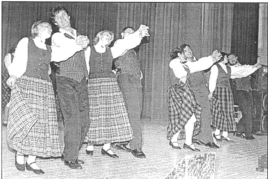
● Rožupes pagasta vidējās paaudzes deju kolektīvs uzstājas ar dejām «Deviņviru spēks» un «Laba dzīve».