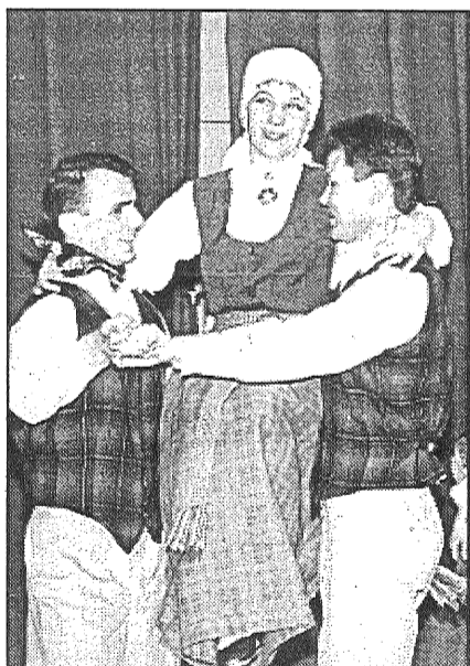
● Preiļu deju kopas «Talderi» temperamentīgajā izpildījumā skatītāji redzēja dejas «Ručers» un «Ciganovskis».

Tradicionālā ikgadējā deju kolektīvu sadancošanās, kas pagājušo piektdien notika Riebiņu kultūras namā, pierādīja, ka rajona dejojāji arī laikā starp lielajiem Vislatvijas dziesmu un deju svētkiem ir pilni dejotgribas, bet viņu vadītājus nepamet izdoma. Uz sadancošanās ieradās 12 kolektīvi. Jau zināmajiem Preiļu, Livānu, Jaunaglonas, Rožupes, Rušonas, Jersikas, Turku deju kolektīviem pievienojās vēl viens — Riebiņu vidējās paaudzes deju kolektīvs. Ar deju kolektīviem parasti ir tā, — ja ir, kas to vada, dejojāji vienmēr atrodas. Tādēļ arī Riebiņu dejojāju vidū daudz tādu, kas dejojusi arī agrākos gados. Savukārt Līču kultūras nama deju kolektīvs gan palicis ar gribēšanu dejojot, bet tam pašlaik nav sava vadītāja. Tāpēc lielajā sadancošanās koncertā dejojāji no Preiļu pagasta bija tikai kā skatītāji.