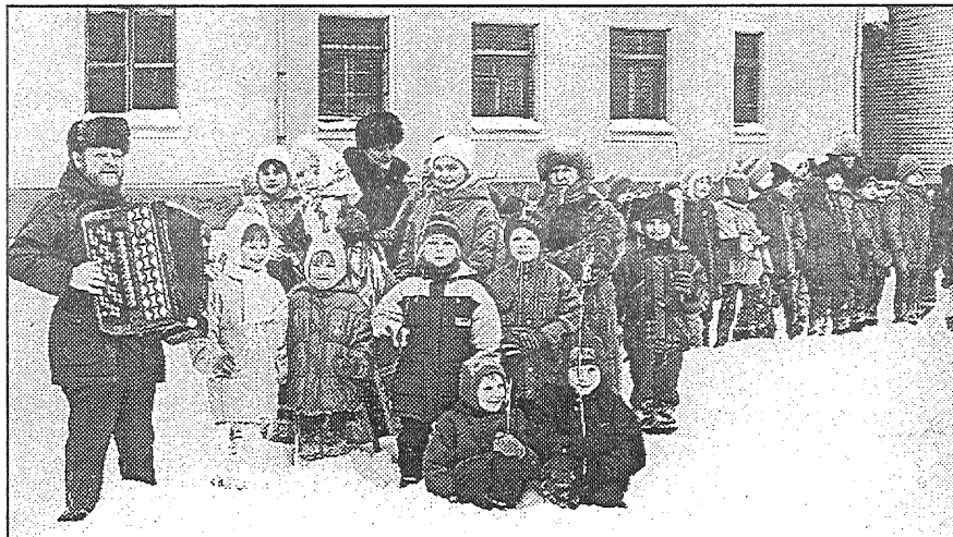
● Masleņica Līvānu 2. vidusskolā.

Kā visās krievvalodīgo skolās, raizes nereti sagādā pedagogu valsts valodas zināšanas. Skolotāji ieguvuši augstāko valsts valodas zināšanu pakāpi. Divus, kam tādas nebija, biju spiesta atbrīvot no darba. Man viņu bija trii cilvēciņi žēl, bet neko nevarēju darīt, jo valodu viņu vietā nevaru iemācīties. Viena skolotāja bija jau pensijā un strādāja tikai ar pagarināto grupu. Otra bija bioloģijas skolotāja. Bija arī kāds cits apstākļi. Skolēnu skaits skolā samazinās, un divām bioloģijas skolotājām pilnu slodzi nemaz nevar nodrošināt. Un, ja paredzēts, ka vidusskolā turpmāk 75 procentu apjomā mācībām būs jānotiek valsts valodā, tad ir skaidrs, kam pirmajam jāzaudē darbs. Šī skolotāja pati atzina, ka