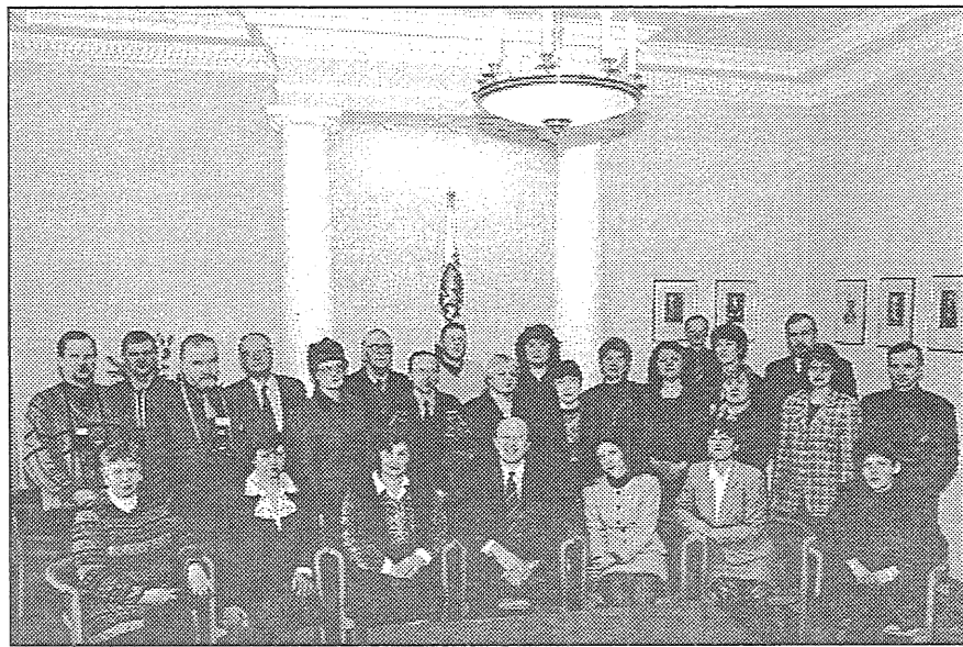
● Latvijas pilsētu un rajonu laikrakstu redaktoru pirmo tikšanos ar jauno Ministru prezidentu Vili Krištopanu iemūžināja fotogrāfs U.Pāže.

Noteikti vēlos atzīmēt, ka bieži pilnīgi nepamatoti izskan viedokļi par to, ka valsts budžetā tiek «apdalīta» kultūra un aizsardzība.